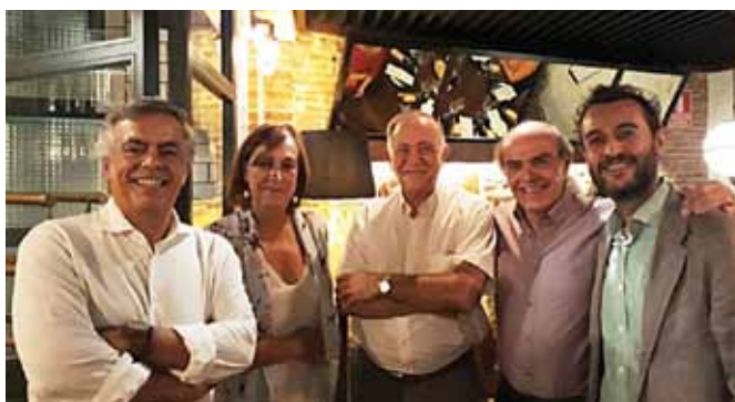
Cena de cierre con expositores españoles del Módulo Internacional Madrid 2017

El último día del módulo se realizó una visita a la agencia española de evaluación de medicamentos y productos sanitarios, en la ciudad universitaria de Madrid. En este encuentro se refirió a las competencias de los distintos organismos en todo el proceso de comercialización de medicamentos y su utilidad terapéutica, entre otras cosas. Media jornada académica se destinó a la visita de la Fundación Gaspar Casals (FGC), que contri-